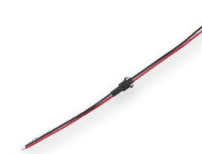
DM113 IP20 47 см (23085)