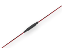
DM111 IP20 47 см (23063)