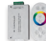
LD56 (для LS606,607) (30 м) 12/24V до 216/432W 14 режимов работы радио (433МГц) (21558)