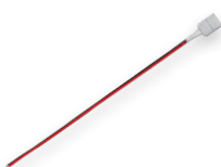
LD181 1 цвет 3528SMD 20 см (23065)