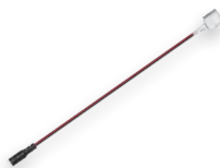
LD103 1 цвет 5050SMD 25 см разъем «мама» (23072)