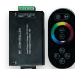
LD55 (для LS606,607) (30 м) 12/24V до 216/432W 14 режимов работы радио (433МГц) (21557)