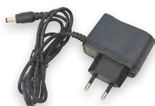
DM105 IP20 6W DC12V (23240) 1.2 м