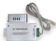
LD10 (для LS606,607) (100 м) 12/24V до 144/288W 11 режимов работы радио (433МГц) (26225)