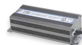
LB007 IP67 100W DC12V (21493)