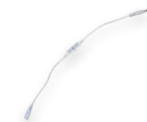
LD50 IP20 12В до 144Вт 8 режимов работы для одноцветной ленты 20 см (26262)