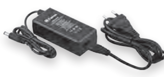
LB005 IP20 30W 60W DC12V (21489) (21490) 1.2 м