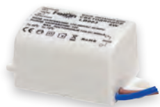
LB003 IP20 6W DC12V (21480)