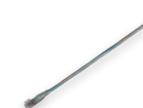
LD107 RGB 5050SMD 26 см разъем «мама» (23073)