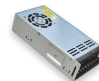
LB009 IP20 350W DC12V (21499)