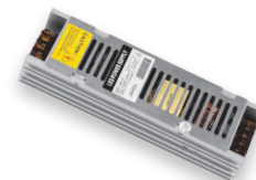
LB009 IP20 100W 150W 200W DC12V (21488) (21496) (21498)